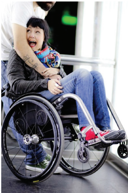
Don't let disability rule your life.